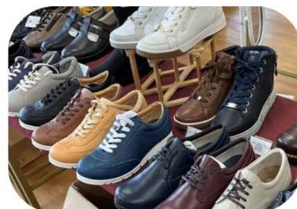
(株)ハ°ラウト・ワークス・ユープ くつ・インソール

※メガネと靴の作成については、予約制となります。カタログに同封されている予約表の提出をお願いします。予約時間については配達便にて決定通知書をお送りしますのでご確認ください。