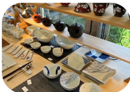
(株)日光陶器 陶器・漆器