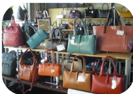
ニューバッグシバタ 鞆・財布