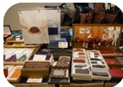
(有)カワグチ企画 印伝・念珠・伝統工芸品