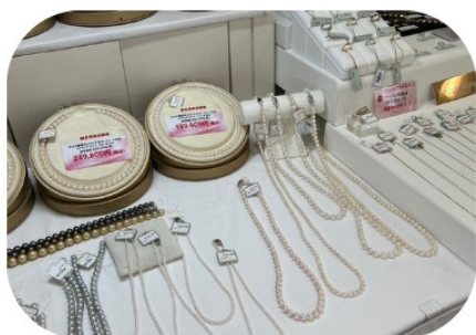
東京真珠(株) ジュエリー・真珠

たくさんの業者が出店。見て・触れて・確かめて おおぜいの方のご来場をお待ちしております。