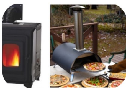
サンケイ商事 ペレットストーブ