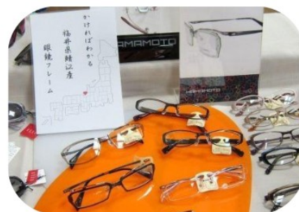
(有)アイ・メイト メガネ